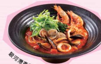
駿河灣產長鬚蝦的義大利漁夫麵