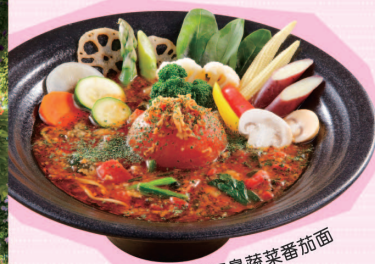
箱根西麓三島蔬菜番茄面

超有人氣的番茄拉麵，充分發揮整顆番茄風味。混合 日本產小麥的自製麵條可感受到精緻的順滑Q彈口 感。可享受香氣撲鼻的小麥本來的香甜風味。